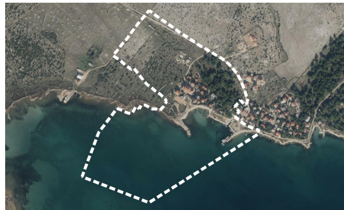
Prikaz obuhvata plana na digitalnom ortofoto snimku

Plan se izrađuje sukladno Zakonu o prostornom uređenju (Narodne novine broj 153/13, 65/17, 114/18, 39/19 i 98/19), Pravilniku o sadržaju, mjerilima kartografskih prikaza, obaveznim prostornim pokazateljima i standardu elaborata prostornih planova (Narodne novine 106/98, 39/04, 45/04 - ispravak i 163/04, 148/10 - prestao važiti, 9/11) i ostalim zakonima i propisima bitnim za izradu dokumenata prostornog uređenja.